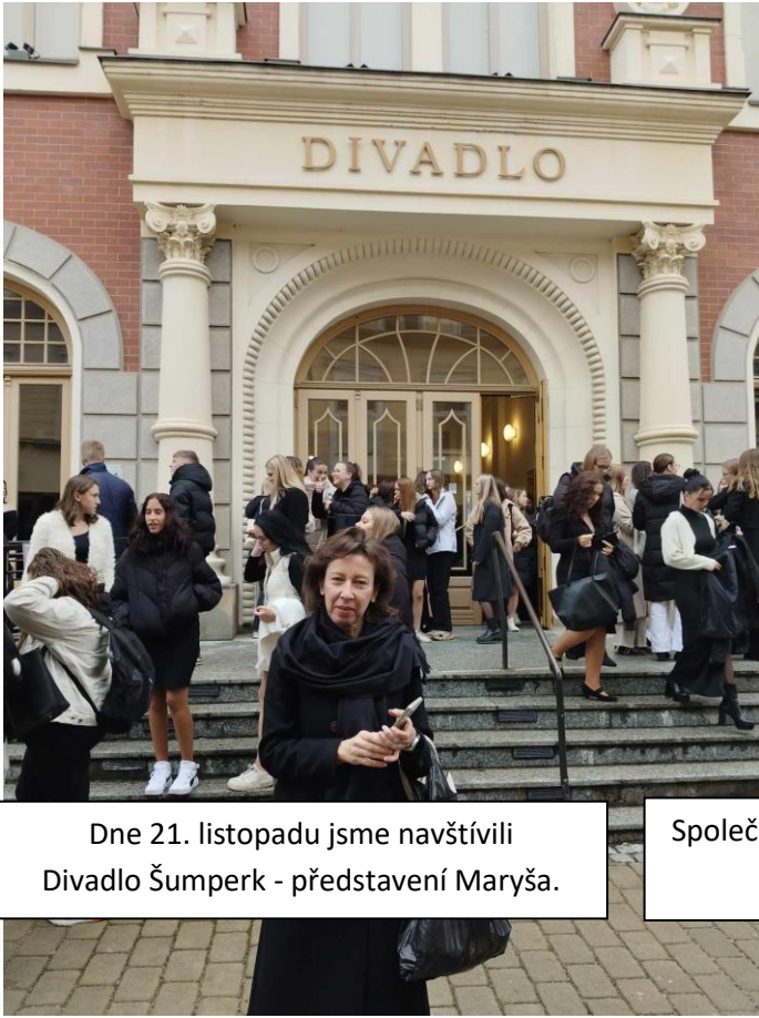
Dne 21. listopadu jsme navštívili Divadlo Šumperk - představení Maryša.