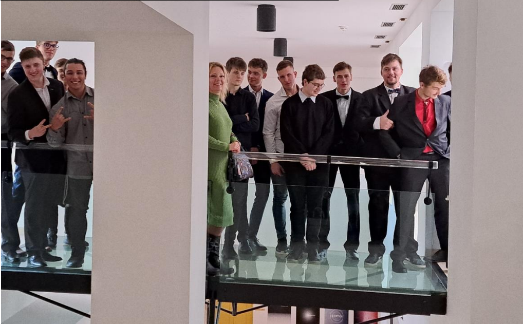
Před zahájením .....